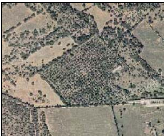
Cultivos leñosos – TIPO_0125: “/otro” – FORZADO: “/no”