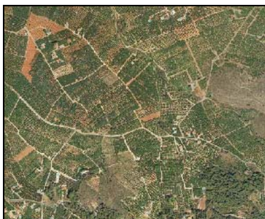
Cultivos leñosos – TIPO_0125: “/frutales cítricos” – FORZADO: “/no”– RIEGO_0123: “/regadío”

No se aplican controles de calidad adicionales.